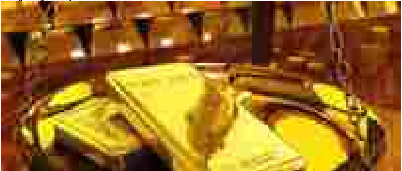
La nuova età dell'oro: tendenze e prospettive

Responsabilità editoriale a cura di Teleborsa