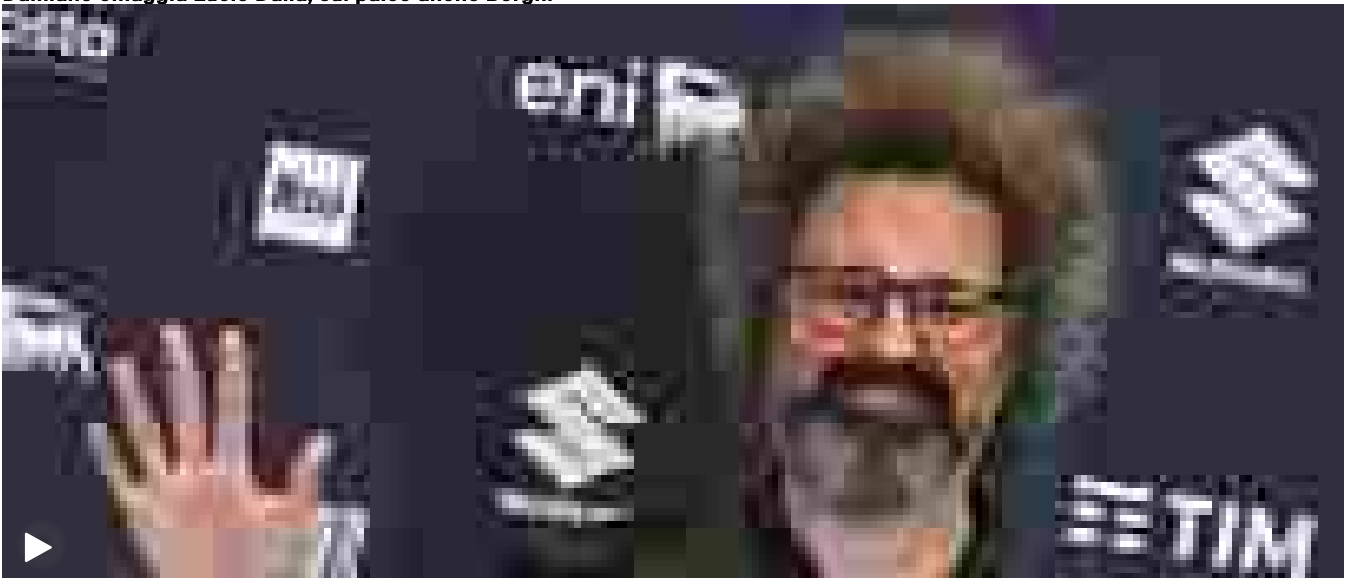
Gli auguri degli artisti per 80 anni di ANSA - VIDEO