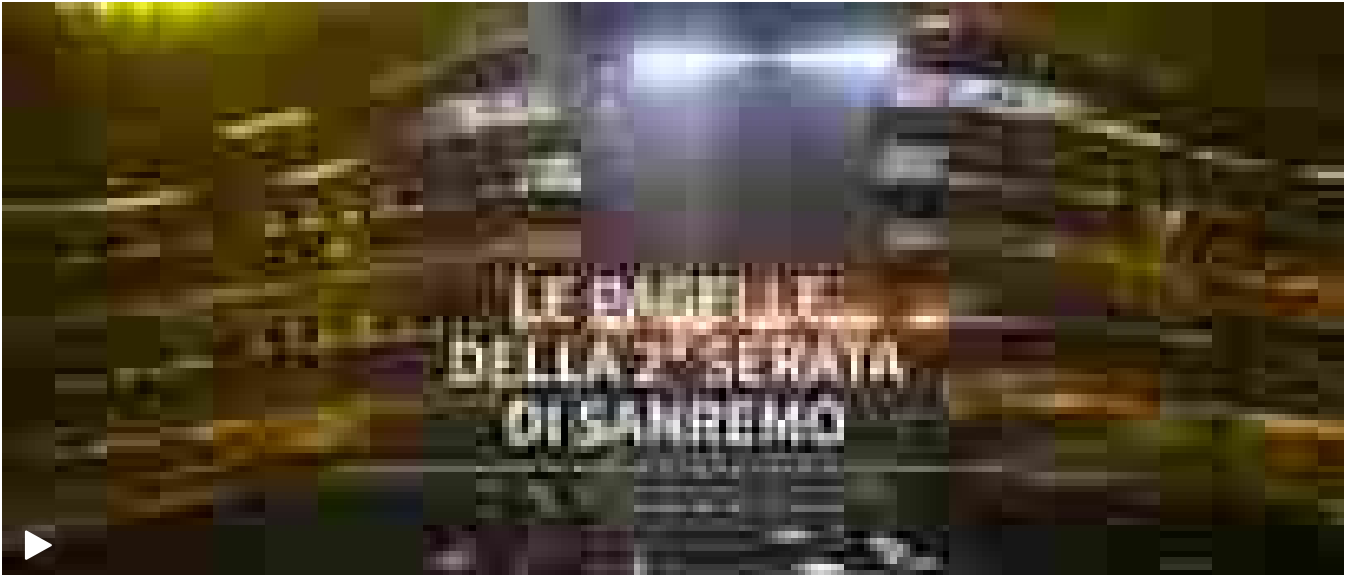
Le pagelle della seconda serata di Sanremo