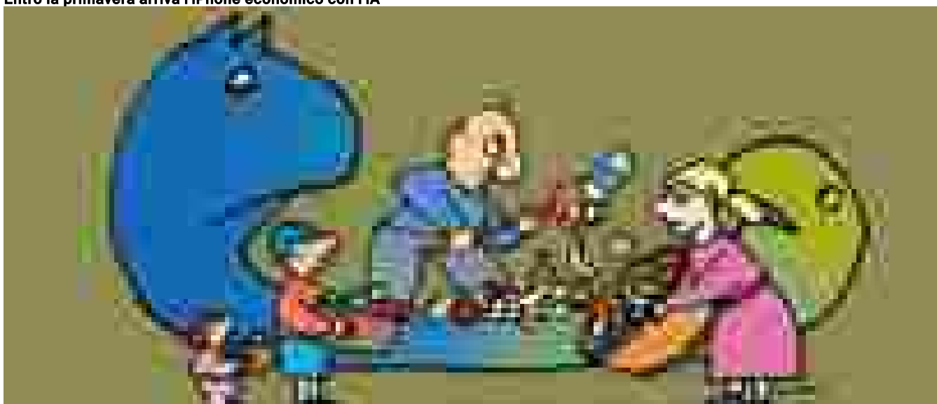
Sale lo spreco a tavola, in Italia si butta cibo per 14 miliardi

Temi caldi Medio Oriente Dazi Trump Murazzi scioperi Giornata contro il cancro / ANSA2030 PIÙ SOSTENIBILI / Finanza & Impresa