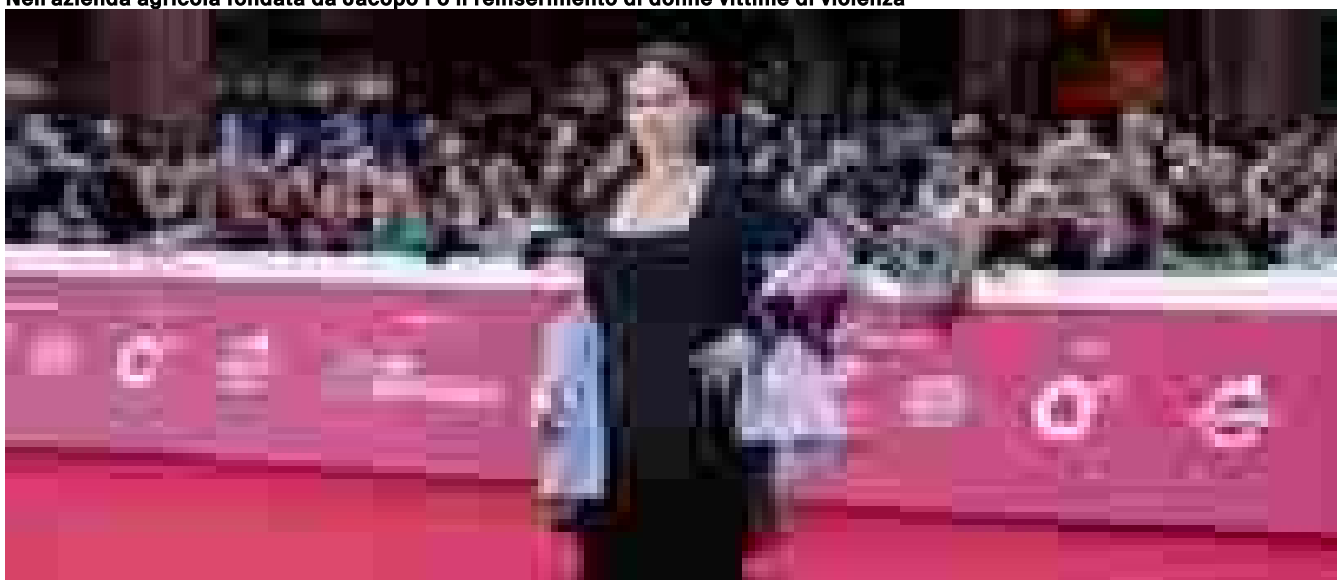
Festival di Cannes, Juliette Binoche presiederà la giuria

Ritaglio stampa ad uso esclusivo del destinatario, non riproducibile.