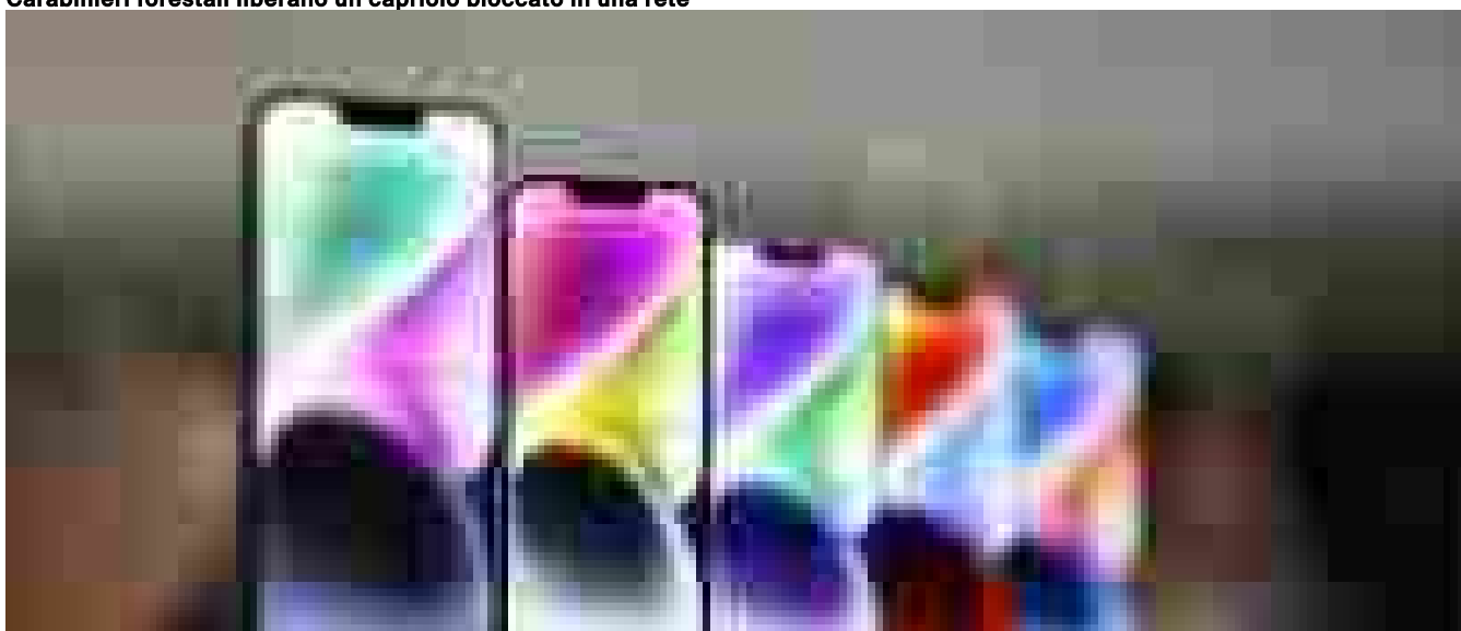
Entro la primavera arriva l'iPhone economico con l'IA