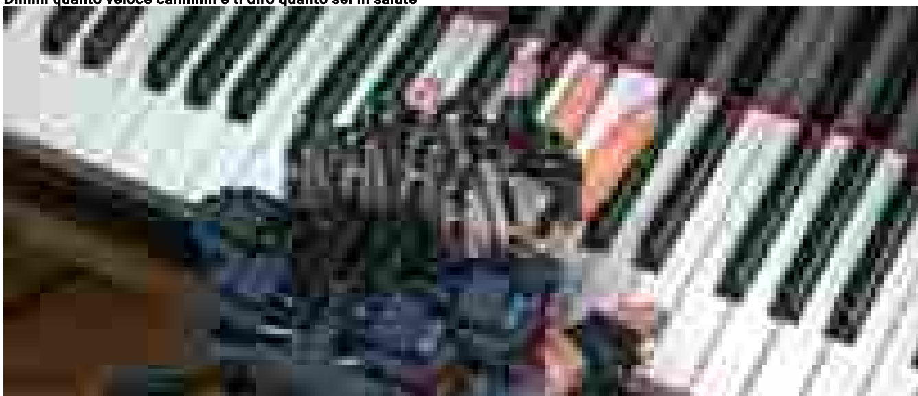
Un esoscheletro per la mano allena i pianisti a virtuosismi impossibili VIDEO