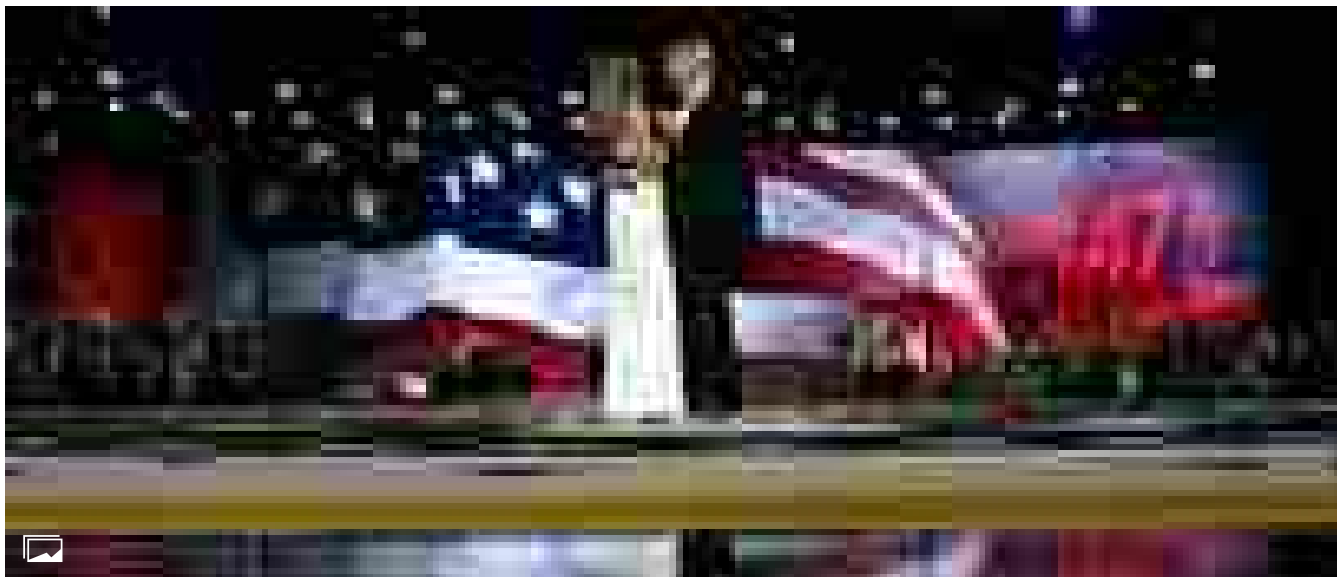
Il primo ballo nel giorno dell'insediamento