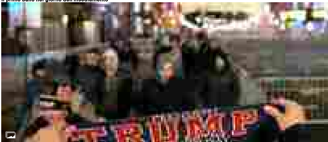
I Maga invadono Washington: 'Trump cambierà l'America'

Ritaglio stampa ad uso esclusivo del destinatario, non riproducibile.