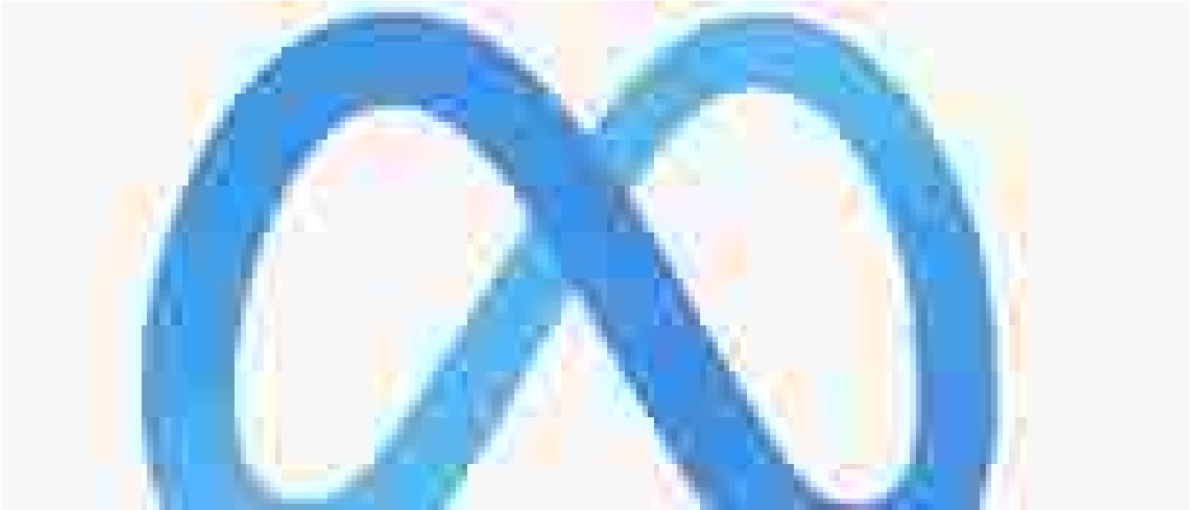
Fact checkers a Meta, annullato quasi un decennio di progressi