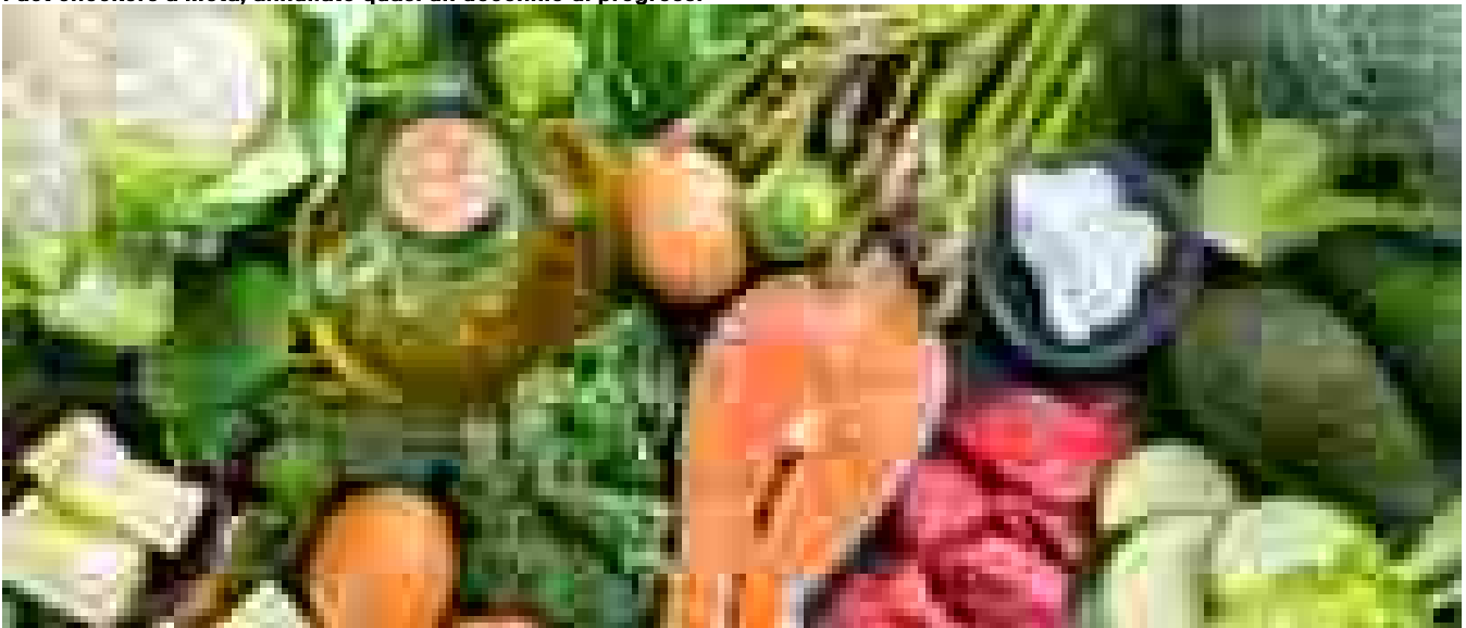
Tumore colon, l'alcol aumenta il rischio e i latticini lo riducono