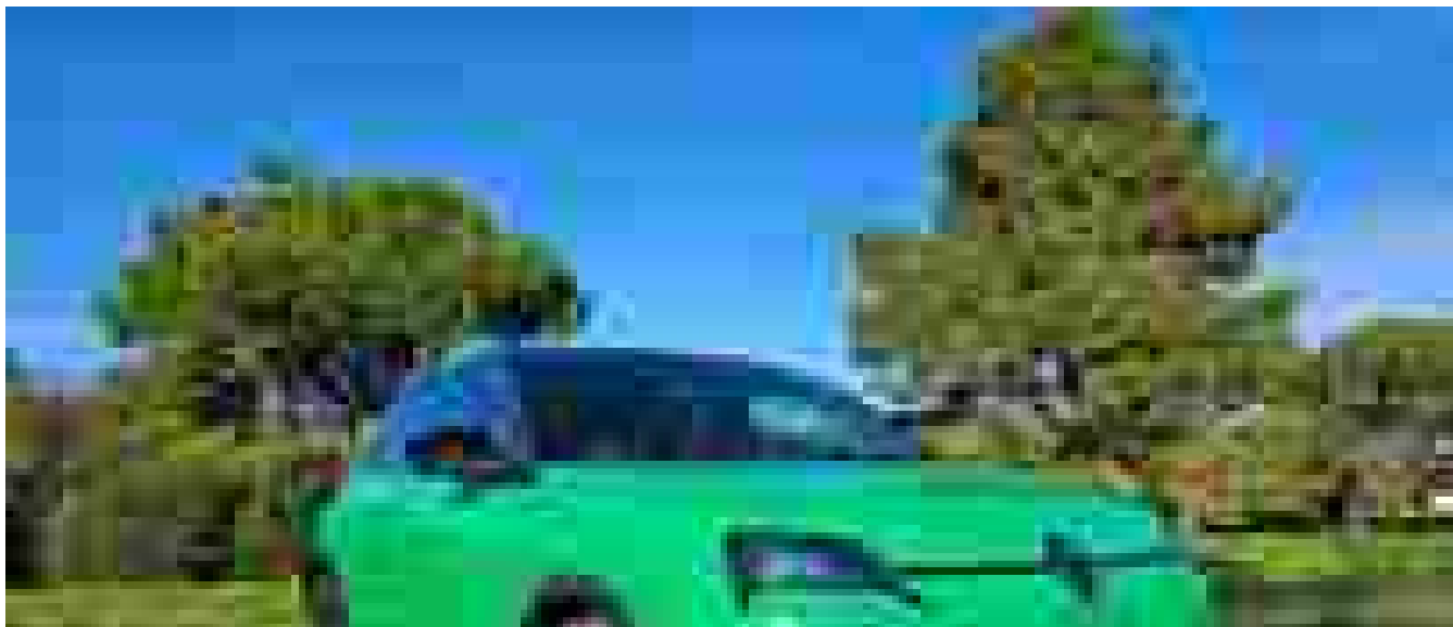
The Car of the Year 2025 è Renault 5 / Alpine A290