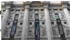
Le imprese italiane innovano e accettano le sfide del presente