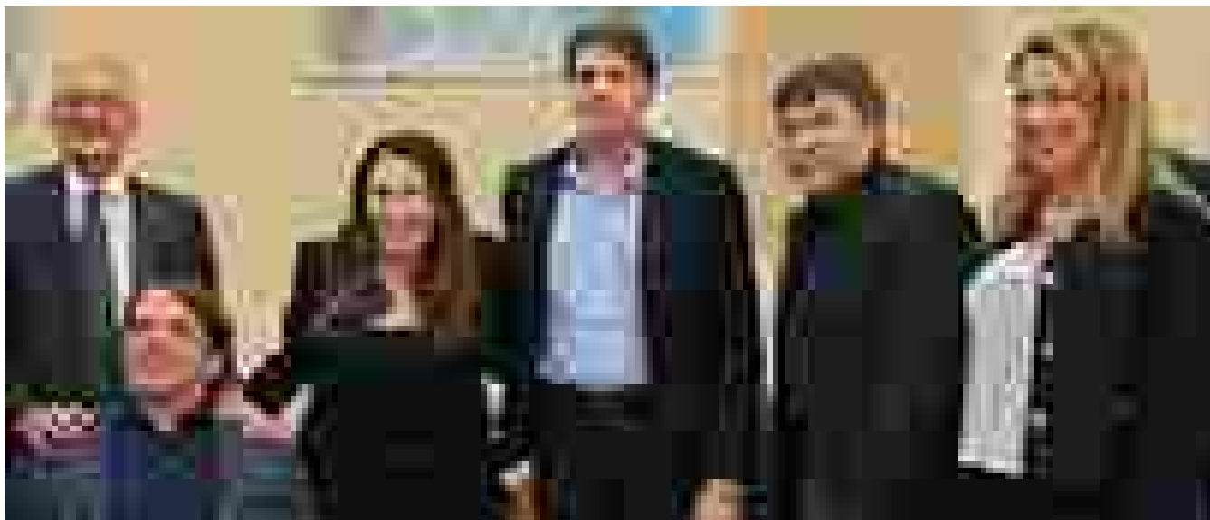
'Pronti a salpare', vela positiva per malattie scheletriche rare

Ritaglio stampa ad uso esclusivo del destinatario, non riproducibile.