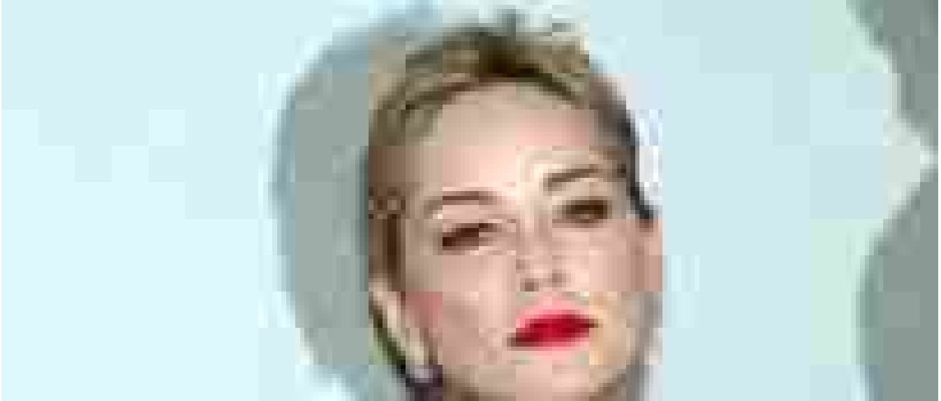
Da Ron Howard a Sharon Stone, è All Stars II Tff 2024