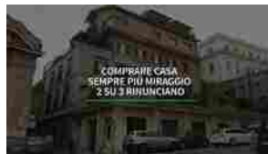
Comprare casa sempre più miraggio, 2 su 3 rinunciano