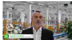
La "corsa" di Comer Industries, tra sfide e ambizioni