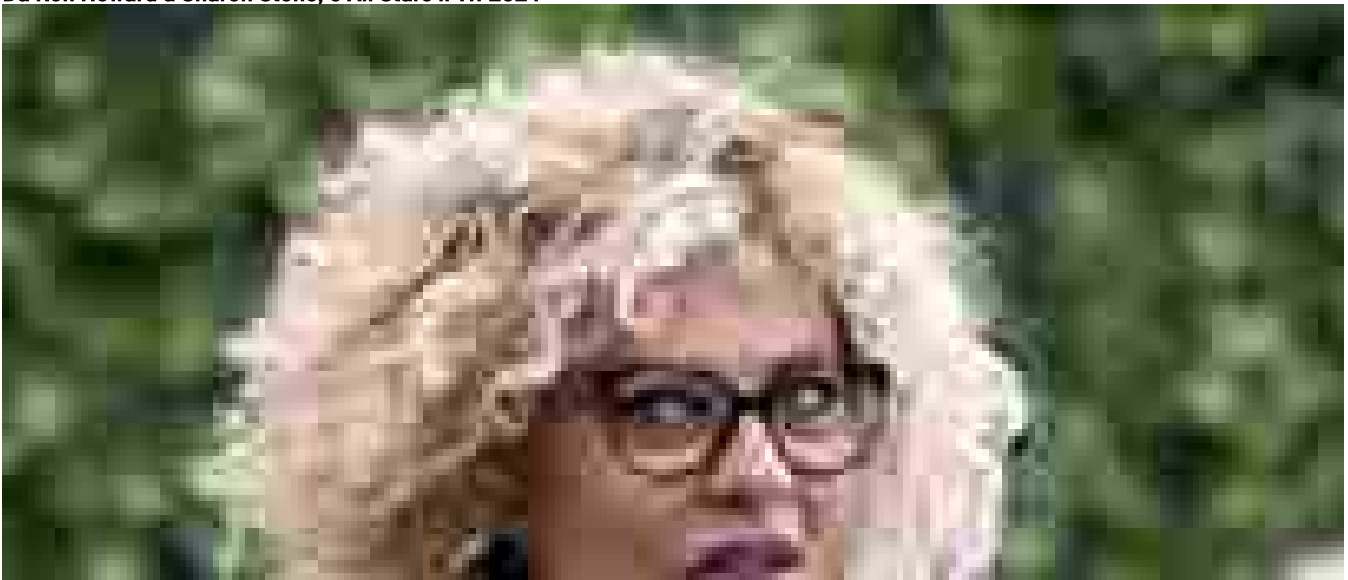
Eva Grimaldi, ho amato Benigni e Amendola

Temi caldi Trump Scioperi Israele Putin Vassallo / Economia PMI