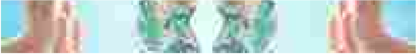
Il diabete può accelerare invecchiamento, danni ad arterie e reni