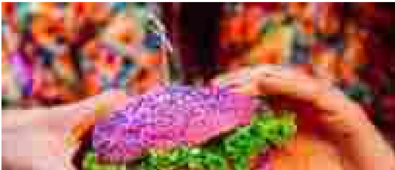
World Vegan Day, festa il primo novembre

Ritaglio stampa ad uso esclusivo del destinatario, non riproducibile.