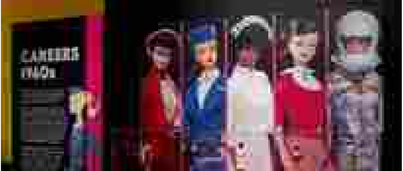
Mondo in rosa, a NY si celebra l'icona culturale Barbie