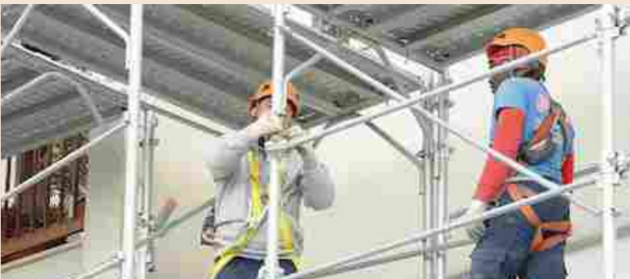
▲ Cantieri e sicurezza, qui gli ingegneri rischiano di più

🔊 Ascolta la versione audio dell'articolo