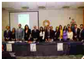
Rinnovato il Consiglio direttivo