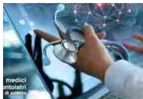
Medici, incontro con una