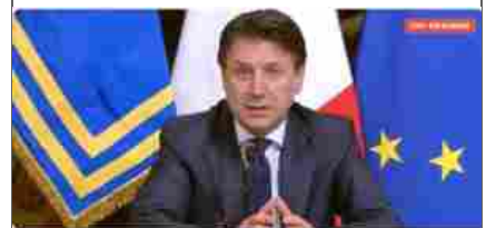
Conte: "Volerai allontanare dalla suocera è motivo valido per ipostamenti."